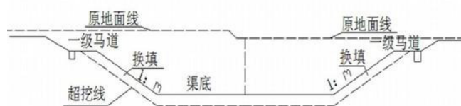
图2 水利施工换填土技术示意图

以排水固结技术为例,它能在加固水利工程的基础上将多余的积水及时排出到外部环境中,主要是充分利用淤泥排水固结后增加的强度进行基础稳定性提升,使每一层填土的厚度都被控制在合理化范围内,以提升稳定性。该技术相对来说比较常用,但是施工时间比较长,经济资源损耗也比较显著。而换填土技术往往会使用质地坚硬、强度高、耐腐蚀和侵蚀能力的碎石、灰土、废弃矿渣等作为替代性材料,替换原有道路中的软土,以提升水利工程地基的稳定性技术 [4] 。虽然后期操作中比较费时、费力,但是保养后的水利工程基础稳定性十分显著(如图2所示)。