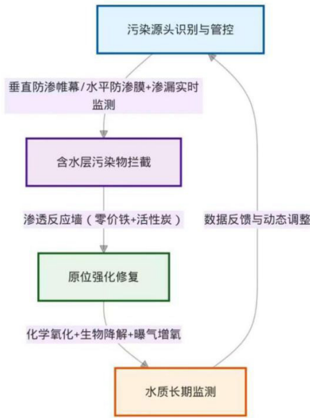
图 2 工业集聚区地下水水工环协同修复技术体系流程图

过程阻断技术的核心是利用工程地质结构特征，构建污染物迁移拦截屏障。研究区地下水流向为西北向东南，在中度污染区与轻度污染区之间的粉砂含水层中，构建渗透反应墙（PRB）。PRB 填充材料选用零价铁（ZVI）和活性炭的混合物，零价铁可通过氧化还原反应降解 \text{Cr}^{6+} 等重金属离子，活性炭可吸附苯、甲苯等有机污染物。结合工程地质钻探数据，PRB 墙体深度设置为 10 - 18 m，与粉砂含水层厚度匹配，墙体长度沿地下水流向垂直布设，确保污染地下水全部经过反应墙处理。此外，在 PRB 下游布设监测井，实时监测出水水质，评估拦截效果。图 2 为水工环协同修复技术体系流程图，清晰展示了源头管控、过程阻断、原位修复的技术衔接关系。