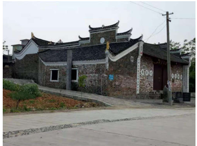
图 1 明朝洪武五年由湖广平章杨昇创建的城步杨家将村杨氏官厅

国名将岳飞也被奸臣杀害了，全国上下都处于一个混乱时期，各地民众造反，北方全面入侵。作为有着民族自尊心的民族英雄杨再兴义不容辞的走在抗金前列与金军金兀术 20 万大军作生死搏斗，最后战死临颖县的小商河上。全国兀术杀害杨再兴后抢走了大量百姓（劳力和女人，老弱病残全部杀光）和数以千万计的金银财物、牛、马、羊牲口，给宋朝造成了重大的战争灾害，才有了岳飞的《满江红》“靖康耻、犹未雪、臣子恨、何时灭……”