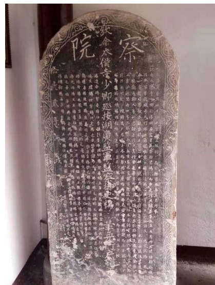
图3 明朝太仆寺卿湖广监军监察御史杨乔然监察湖广军赴城步大竹坪杨氏官厅题刻的“察院”石碑

在南宋由于杨再兴的英勇无畏的牺牲精神,给全国士兵提起了复仇的抗争精神,杨再兴部下纷纷要求为杨再兴报仇,以振国威,在明朝明英宗时期由于英宗是少儿皇帝才九岁,所有国内朝中大事由于谦把握,军事上由杨洪等“三杨内阁”共理军国大事,在军事上使瓦剌部占劣势,通过几次小战争,瓦剌部队连连吃亏后逐渐放弃了入侵。 [1] 使明朝恢复了安宁。杨洪的威名使北部瓦剌部属,闻风丧胆,谈杨色变,藏在山谷间的间谍,只要窥见旌旗知为杨洪,便奔窜相告:“杨王来也、不可出”!杨洪呈报的御敌之策“屡见嘉纳”。纪洪久居宣府,治军严厉,兵精马强,为当时边将之首,而且守边抚民,御外海内,勋功卓著位登极品。以致有万历十年彰武伯杨瑀回乡城步大竹坪杨氏官厅祭祖时题匾“勋裔”二字。