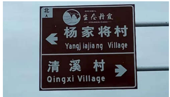
图 4 城步杨家将村被国家住建部确定为国家级民俗文化村前沿阵地，充分领会它的核心价值，并将其为城步的经济发展，旅游开发建设新型的绿色环保天然氧吧一流的国家公园——城步而努力。

因此要借现在这一千载难逢的机会，重点开发修复将军的居住区，古民居、杨氏官厅、孔圣庙、飞山庙、蓝玉故里等等，把它打成一个考证苗族历史文化、苗族古文、苗族服饰的