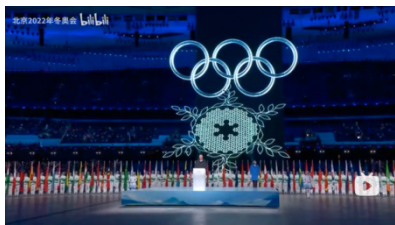
图 2.2 2022 年北京冬奥会开幕式转播画面 - 嘉宾致辞平拍大全景

在 2022 年北京冬奥会开幕式的转播中，运动员入场、奥林匹克会旗入场、升旗以及文艺演出等多个缓解段落中，关系镜头都比 2008 年北京奥运会开幕式的转播有了显著的增多，在流程体量一定的情况下，更多的关系镜头可以给电视观众带来更多的信息，帮助观众更好地通过电视镜头掌握奥运会开幕式现场的全貌和更多细节。关系镜头的设计一方面是转播团队制作理念的升级，另一方面也是转播团队与开幕式导演团队更深度、更到位的协作的结果，转播画面中关系镜头的数量说明两个团队在前期工作中进行了比 2008 年北京奥运会开幕式更多的磨合，从而合力为全球数亿电视观众带来了更理想的观看体验。