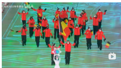
图 1.2 2022 年北京冬奥会开幕式转播画面 - 比利时出场代表团全景

这一情况在 2022 年北京冬奥会开幕式的转播中有了相当大的改观。代表团出场时的大多数全景镜头，仍旧由正面