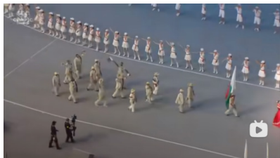
图 1.1 2008 年北京奥运会开幕式转播画面 - 哥斯达黎加出场代表团全景

机位的穿帮是多讯道电视节目制作过程中几乎不可避免的问题，不同机位在不同位置同时开展不同拍摄任务的过程中，时常出现一台机位的画面中有另一台机位及其讯道摄像师拍摄的工作画面，此之为多讯道电视制作中的穿帮现象。在 2008 年北京奥运会开幕式中运动员入场这一环节，机位的穿帮问题尤为明显。不同代表团的旗手及运动员沿体育场一侧入口入场，代表团的全景画面由位于高处的固定机位拍摄。在该环节的镜头序列中，还有包括旗手的单人画面、代表团运动员的群体景等画面，而上述细节画面则由位于体育场跑道边的斯坦尼康摄像师担任。由于俯拍的全景画面要试图将代表团的所有人员囊括在内，代表团的队形又呈长条形纵队，这就使得代表团的全景画面中多出了代表团以外的“无效信息”，甚至包括跑道外侧的若干位斯坦尼康摄像师。虽然这些摄影师均身着黑色工作服，他们在灰色跑道的地面作为背景的画面中仍然极为明显（如图 1.1）。在 2008 年北京奥运会开幕式代表团出场环节，此类穿帮镜头曾多次出现，这对于电视观众的沉浸式观赏造成了极大的影响。