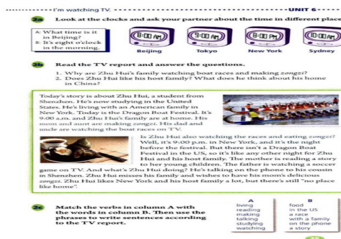
图2 七下 Unit 6 I'm watching TV. Section B 2b

例2:七下6单元B部分阅读篇章(见图2),是一篇关于在美国学习的中国留学生的故事,以此口吻讲述端午节这天他们一家所做的事,不仅涉及端午节的传统食物粽子、传统活动赛龙舟,还有传统佳节亲人间电话问候,有不同国家的时差等细节,而最后一句“no place like home”更是表达了远在他乡游子对故土的思念。