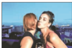
图3 九年级 Unit 10 You are supposed to shake hands. Section A 2d

Katie: How was the welcome party for foreign students last night? John: Great! I made some new friends. But a funny thing happened. Katie: What? John: I met a Japanese boy called Sato, and as soon as I held out my hand, he bowed. Katie: That's how people in Japan are expected to greet each other. It's impolite if you don't bow. John: I didn't know that. So I just stood there with my hand out. Finally, I returned the bow. Katie: I remember when I first met Marie last year, I did the same thing. I held out my hand and to my surprise, she kissed me on both sides of my face! John: I wouldn't mind that! Katie: Very funny. Later I found out French people are supposed to kiss when they see each other.