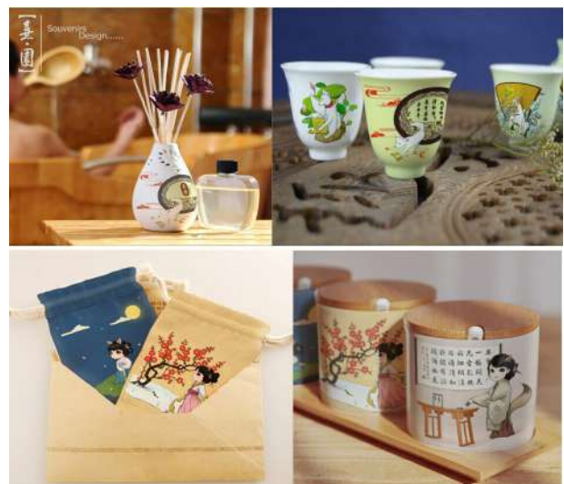
图2 “丽娘求师”旅游纪念品实例

以笔者指导团队为中国江西朱子文化园开发的“丽娘求师”为例,将丽娘与朱熹的一段关于博爱与笃学的纠葛通过图形的方式进行情景再造,传达出一种“学识不论出身,人人都有求学探索资格”的积极价值观。图2这种手法直白易读为地域文化的传承和发展构建了良好的媒介。