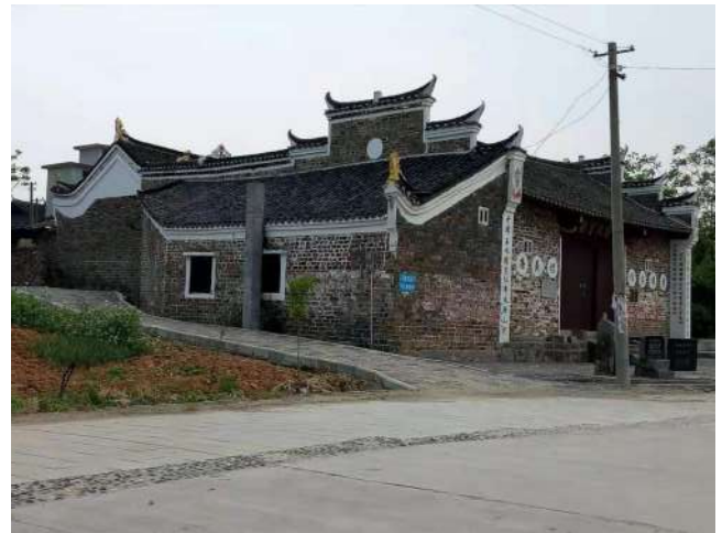
图 1 明朝洪武五年由湖广平章杨昇创建的城步杨家将村杨氏官厅

国名将岳飞也被奸臣杀害了，全国上下都处于一个混乱时期，各地民众造反，北方全面入侵。作为有着民族自尊心的民族英雄杨再兴义不容辞的走在抗金前列与金军金兀术 20 万大军作生死搏斗，最后战死临颖县的小商河上。全国兀术杀害杨再兴后抢走了大量百姓（劳力和女人，老弱病残全部杀光）和数以千万计的金银财物、牛、马、羊牲口，给宋朝造成了重大的战争灾害，才有了岳飞的《满江红》“靖康耻、犹未雪、臣子恨、何时灭……”