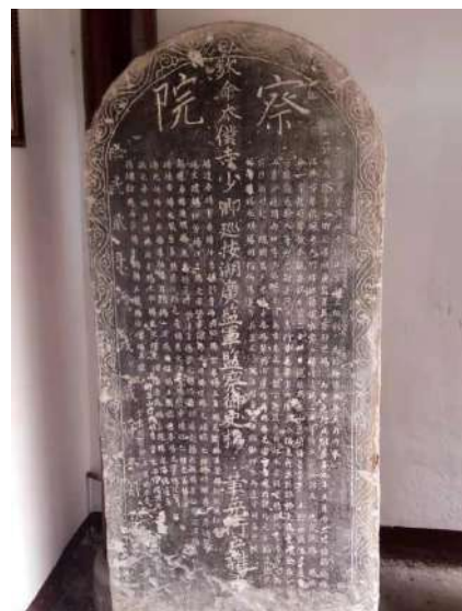
图 3 明朝太仆寺卿湖广监军监察御史杨乔然监察湖广军赴城步大竹坪杨氏官厅题刻的“察院”石碑

在南宋由于杨再兴的英勇无畏的牺牲精神，给全国士兵提起了复仇的抗争精神，杨再兴部下纷纷要求为杨再兴报仇，以振国威，在明朝明英宗时期由于英宗是少儿皇帝才九岁，所有国内朝中大事由于谦把握，军事上由杨洪等“三杨内阁”共理军国大事，在军事上使瓦剌部占劣势，通过几次小战争，瓦剌部队连连吃亏后逐渐放弃了入侵。 [1] 使明朝恢复了安宁。杨洪的威名使北部瓦剌部属，闻风丧胆，谈杨色变，藏在山谷间的间谍，只要窥见旌旗知为杨洪，便奔窜相告：“杨王来也、不可出”！杨洪呈报的御敌之策“屡见嘉纳”。纪洪久居宣府，治军严厉，兵精马强，为当时边将之首，而且守边抚民，御外海内，勋功卓著位登极品。以致有万历十年彰武伯杨瑀回乡城步大竹坪杨氏官厅祭祖时题匾“勋裔”二字。