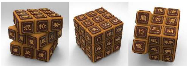
图3 “方言注解魔方”设计

在上海旅游纪念品设计题目中，笔者指导团队设计的以上海三字方言为主题的“方言注解魔方”，图3对有上海话学习诉求的购买者起到寓教于乐的作用，同时也使观光者通过简单的方言交流与当地人产生情感交流，部分意思只有方