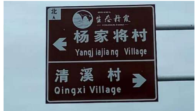
图4 城步杨家将村被国家住建部确定为国家级民俗文化村前沿阵地，充分领会它的核心价值，并将其为城步的经济发展、旅游开发建设新型的绿色环保天然氧吧一流的国家公园——城步而努力。

因此要借现在这一千载难逢的机会，重点开发修复将军的居住区，古民居、杨氏官厅、孔圣庙、飞山庙、蓝玉故里等等，把它打造成一个考证苗族历史文化、苗族古文、苗族服饰的