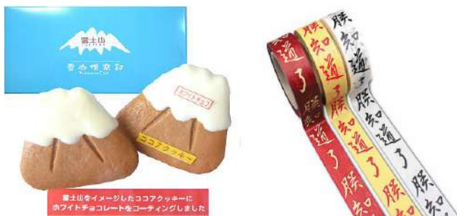
图1 日本静冈县和台北故宫的旅游纪念品

实际上消费者所诉求的旅游纪念品是具有旅游地域特征、寓意的产品。透过这件产品可以让消费者深切感知当地的文化、情感、甚至生活方式，成为人与地域之间的情感纽带，还可以使他们的旅途变得兴味盎然，回味无穷。旅游纪念品应是纪念性、符号性、知识性、创意性与实用性的有机结合，扎根地域文化，融入地域特色元素的产品具有绝对的不可复制性。以日本静冈县出品的热销富士山形饼干为例，白色的奶油巧克力雪山顶，象形的饼干设计，生动可爱，受到消费者的高度青睐，但倘若将它摆在大阪城天守阁售卖，定会令各国观光者贻笑大方。景点要产出打动消费者的旅游纪念品，必须将自身独有的优秀地域文化资源元素、地域特色文化符号、地域标志景观建筑资源、地域抽象传说情景等内容通过提炼、归纳、整合转译为可用产品语意、图形等设计要素，运用到旅游纪念品的定制化创新设计当中，最终打造具有地方特色和文化的產品。