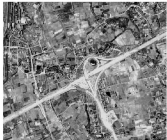
图2 高质量遥感影像图

土地进行检测后,遥感技术的控制能力很强,所以收集的影响材料也很精确。相对于常规的调查方式,不仅在成本方面有很大的降低,且减少了人员的安排和奔波等,大大节约了资源,提高了工作效率。利用遥感技术进行土地调查,影像资料对于小区域的监控会非常详细,相较于传统的图像资料来说不仅清晰度会上升而且画面内容会更加丰富,如图2。