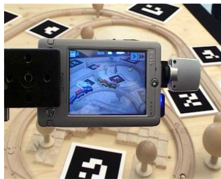
图2 增强现实在游戏中的应用