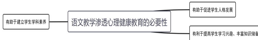
图 1 小学语文课程渗透心理健康教育的必要性

在小学语文教学中渗透心理健康教育是十分必要的, 具体可以从以下几点着手展开分析, 如图 1 所示。