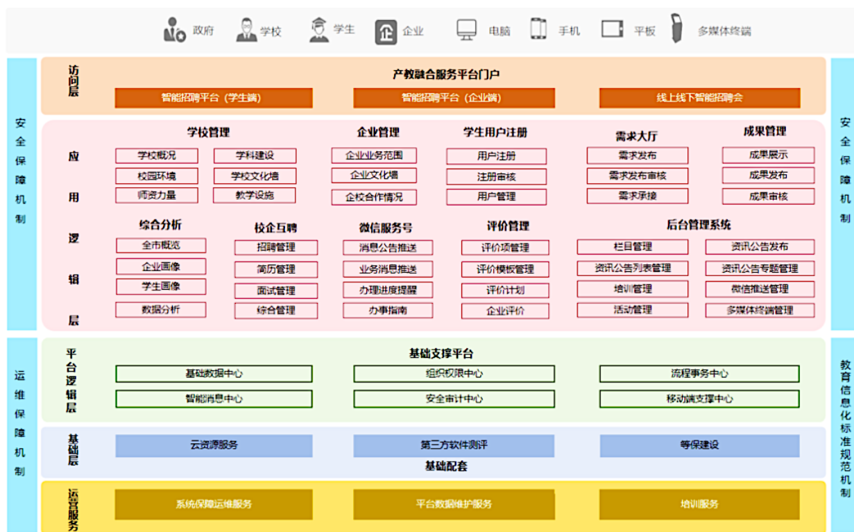
图2 产教融合服务平台总体架构图

职业教育的人才需求 [5] 。借助这个平台,学校能够实时掌握产业的发展方向和市场需求,各企业可以参与学校的人才培训活动并发布对人才的需求信息,教师能够接触到更丰富的产业资讯和教育资源,学生有机会获得更多的实际操作和就业机会,政府则能实时掌握职业学院与企业之间的合作状况,并对双方的合作效果和质量进行监控。多个主体相互合作交流,打造出一个动态、互动、持续发展的“共生、互生、再生”酒店产业人才教育生态供应链,为酒店产业的创新发展提供强有力的人才支撑。