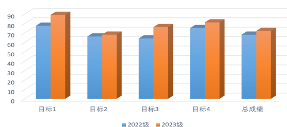
图 2 2022 级与 2023 级课程各目标达成度比较

②学习投入度与满意度大幅改善: 课堂观测数据显示, 2023 级学生有效互动频次是 2022 级学生的 1.77 倍。课程教学满意度测评, 2023 级评分为 92 分, 2022 级评分为 88 分。学生普遍反馈“课堂内容丰富, 案例学习让知识活了起来”、“BOPPPS 节奏让自己始终紧跟课堂”、“感受到了专业的价值和使命感”。