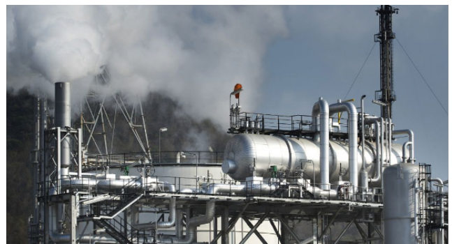
图 1 工业源 VOCs

工业源 VOCs 是指经由工业生产排放出的 VOCs 挥发性有机物, 随着城市化进程的加快以及工业的发展, 工业生产中排放出的废气总量越来越多, 挥发性有机化合物作为常见的排放气体, 就成为大气环境的主要污染源。此背景下, 就需要相关人员加强对工业源 VOCs 的研究分析, 根据工业生产的类型分析污染源的性质特点, 在此基础上研究污染治理技术。然而工业规模较大, 再加上工业的生产流程一般较为复杂, 就导致工业源 VOCs 也十分复杂, 一定程度上增加治理难点。就要求治理人员结合先进的技术与设备, 对废气进行深入分析, 综合相关信息制定切实可行的治理策略。